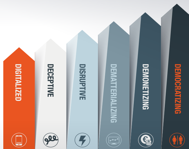
Afbeelding 2: Steven Kotlers 6 D's van exponentiële groei

Wat kunnen we uit het voorgaande afleiden over de toekomst van draagbare sensortechnologie in het algemeen en het slimme incontinentiemateriaal in het bijzonder? Wanneer steeds meer mensen de voordelen van draagbare sensortechnologie inzien, zal er democratisering van deze technologie en het slimme incontinentiemateriaal plaatsvinden. In de toekomst zullen we dus allemaal toegang hebben tot uiteenlopende producten en diensten waarbij gebruik wordt gemaakt van slimme draagbare sensoren, waaronder slim incontinentiemateriaal. Dankzij deze technologie zullen zorgverleners niet alleen te weten komen wanneer het incontinentiemateriaal van een bewoner aan vervanging toe is, maar bijvoorbeeld ook of de bewoner een infectie heeft, is blootgesteld aan luchtvervuiling, zich binnen of buiten de muren van de instelling bevindt, een stabiele hartslag heeft, enzovoorts. Voor ons bestaat de volgende stap uit het vaststellen welke informatie we precies willen ontvangen, en het bepalen hoe we die informatie kunnen inzetten met als doel de best mogelijke zorg te verlenen.